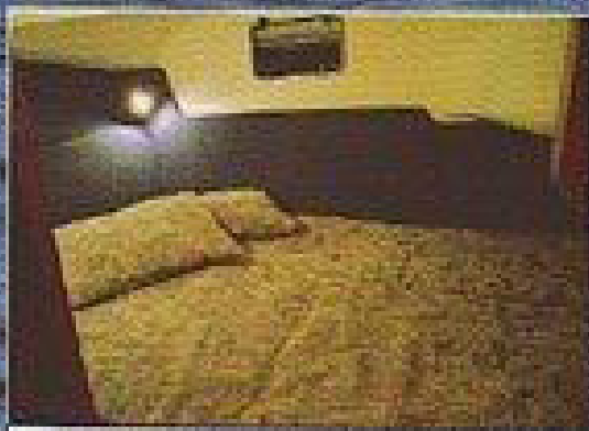
"Owners cabin" under sittbrunnssduken har en rymlig dubbelköj och ordentlig sithöjd.