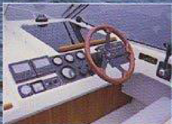
Förarplatsen har plats för tre personer. Alla reglage inom räckhåll.

F orbina 8000 är en snabb, öppen dagbåt med mycket gods innerutrymme. Det lindrivna skrovet har en skarp V-profil som ger utmärkta sjöegenskaper och fartresurser mellan 25–40 knop med en ekonomisk diesel.