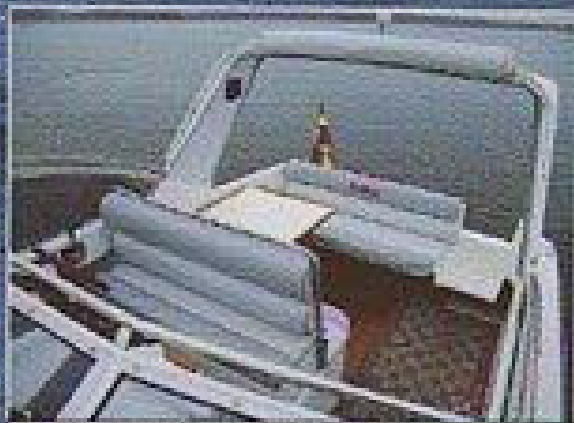
Dinetten om styrbord, bordet har en utdragskåpa. Ryggstödet är gemensamt med förarsätets.