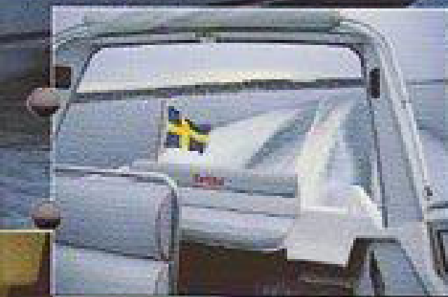
Det lindrivna skrovet ger ett fint aktersvall.