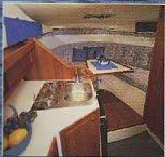
Ruffen söd åttanfrån. Om babord vid nedgången är pentryt, rakt fram V-soffen med bord, som går att förvandla till en bekväm dubbelköj.