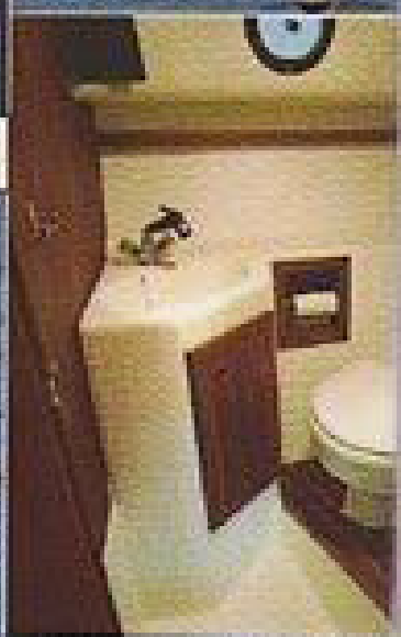
Toaletten är komplett med sep och plats för toalettseier.